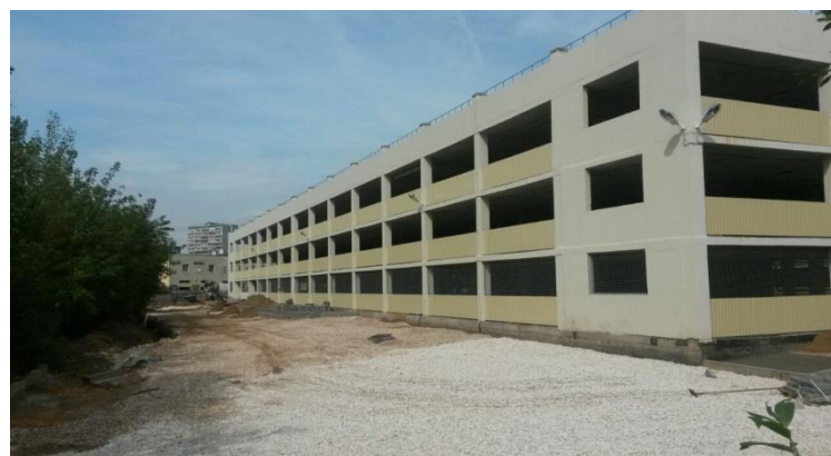
Краснодарская, вл. 70