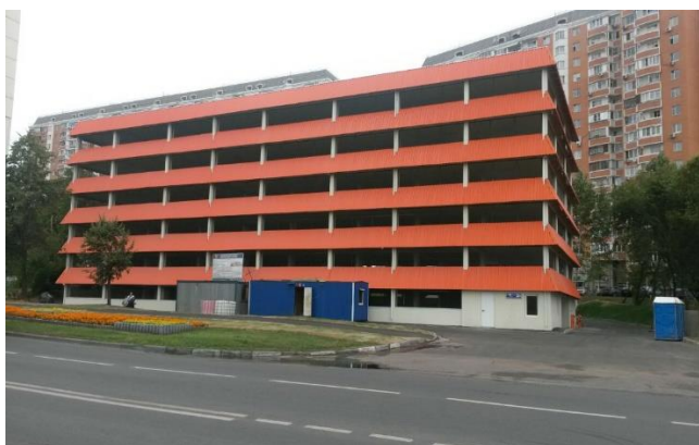
Верхние поля, вл. 33-35

Застройщик – ГУП «Дирекция строительства и эксплуатации объектов гаражного назначения города Москвы».